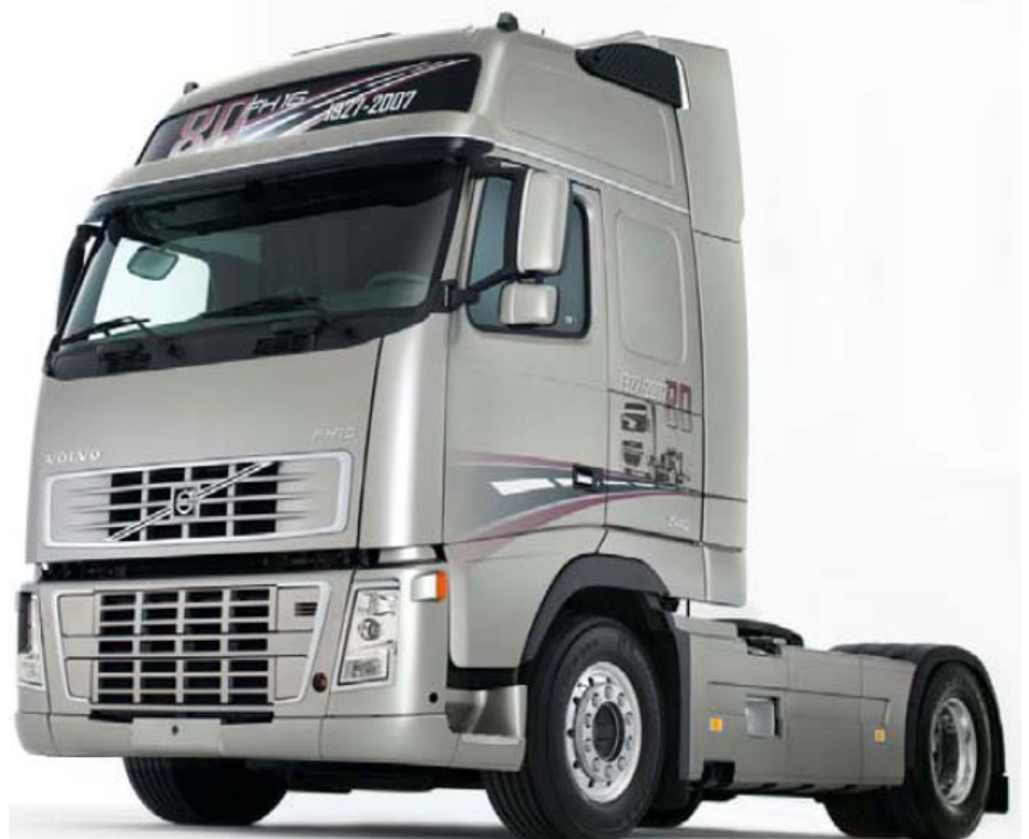
Cabine in Jubileum Zilver Metallic met in kleur gespoten grill