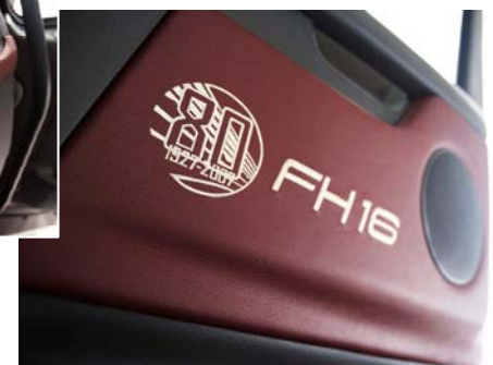
Deurpanelen met logo

De afbeeldingen tonen een FH16. Bij de FH 520 een lederen stuurwiel maar alleen in grijs en daarnaast geen FH16 logo's en chromen exterieurdelen.