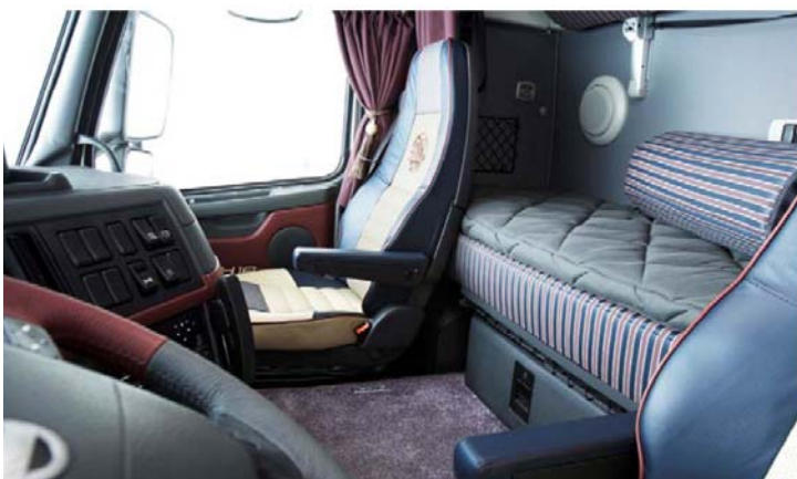
"Art Deco" interieurafwerking