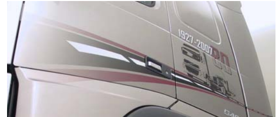
Striping op de zijkant