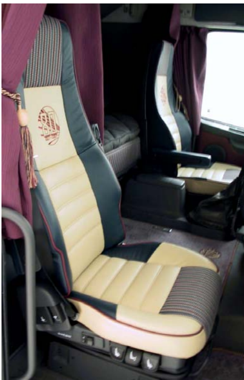
"Art Deco" stoelbekleding